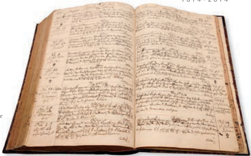
Auch im Wiener Krankenhaus sind noch alte Krankenprotokolle seit 1774 erhalten, im Bild eine Doppelseite aus dem Jahr 1777. In dieser Weise wurden die Patienten bis Jänner 1946 erfasst.

Gemäß den diesbezüglich sehr fortschrittlichen Ordensregeln sollten sowohl Krankenpfleger als auch Wundarzt (Chirurg, immer ein Barmherziger Bruder) und Apotheker den „Medicus“ („Spitalsphysikus“, nach heutigem Sprachgebrauch Internist) bei den täglichen Visiten begleiten. Er war der leitende Arzt, der im Allgemeinen akademisch ausgebildet und weltlichen Standes war.