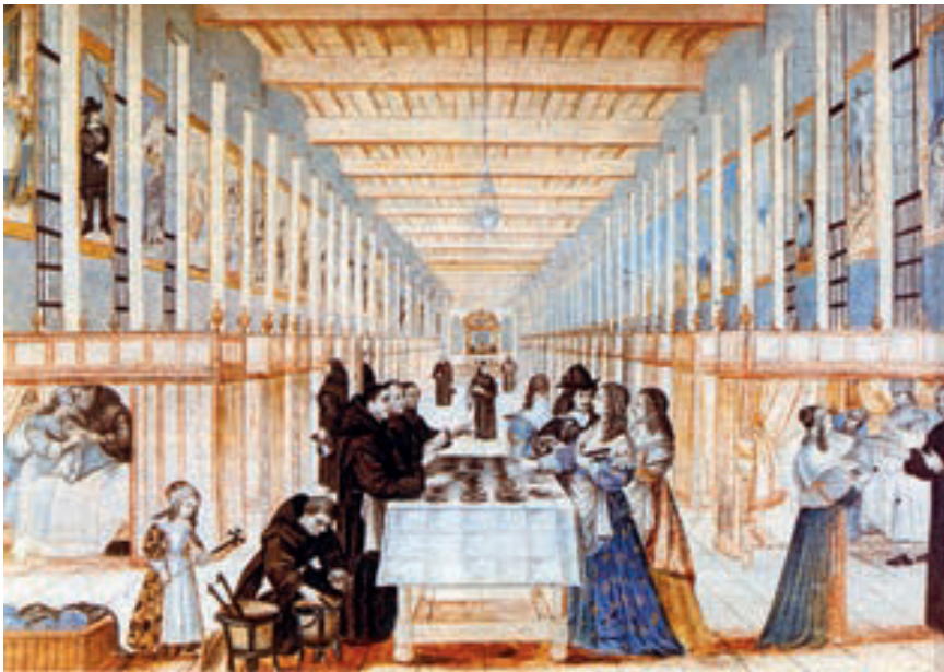
Hôpital de la Charité der Barmherzigen Brüder in Paris: Maria de' Medici hatte im Jahr 1600 den französischen König Heinrich IV. geheiratet und rief 1606 die Barmherzigen Brüder nach Paris. Der Hôpital wurde ab 1613 erbaut und war eines der prunkvollsten Hospitäler im Orden. Wie damals üblich durften hochgestellte Persönlichkeiten des Hofes bei der Ausgabe des Mittagessens bedienen. (Gemälde eines unbekanntes Künstlers nach einem Kupferstich von Abraham Bosse, 1602 bis 1676)